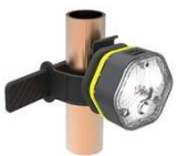
Sangle pour Tube

Exemples d'accessoires disponibles: (Module LED vendu séparément)