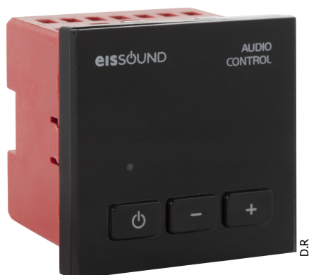
09253 – noir

L'unité de commande audio est une solution autonome qui vous permet d'envoyer le signal audio d'une zone à une autre, par exemple depuis un téléviseur situé dans une pièce et de l'étendre à une zone différente. L'unité a un bouton ON / OFF et une commande de volume + / - .