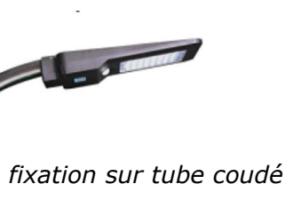
fixation sur tube coudé