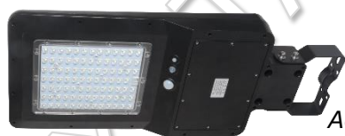
Accessoire de fixation. fourni

2) Mode détection : il se met automatiquement à la luminosité souhaitée (60% - 80% - 100%) quand un mouvement est détecté à une distance \leq 12m puis en luminosité réduite à 30% après 20 secondes sans détection.