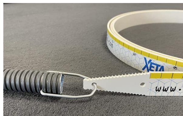
Système permettant de clipser la gaine