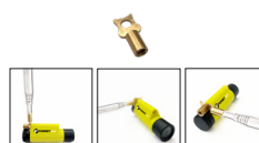
*NOUVEAU* Adaptateur à angle droit