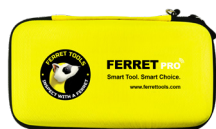
Étui rembourré en EVA